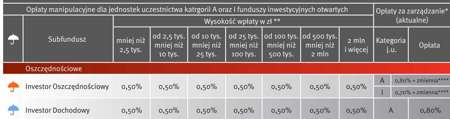
Tabela opłat dla Getin Noble Bank S.A.

* Towarzystwo pobiera z tytułu zarządzania i reprezentacji funduszu/subfunduszu wynagrodzenie w wysokości określonej w powyższej tabeli wyrażonej jako % średniej wartości aktywów netto funduszu/subfunduszu przypadającej na jednostki uczestnictwa w skali roku.